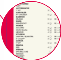
Prontuario applicativo sul retro